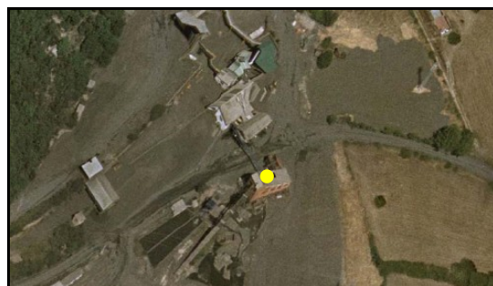
Castillete de acceso a una explotación subterránea.