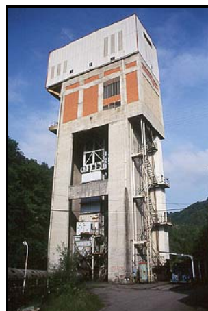
Ejemplo de accesos a explotaciones subterráneas.